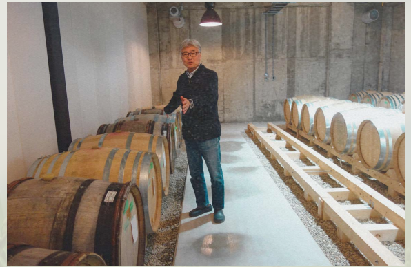
国内屈指のブルゴーニュワインの専門家によるワイナリーツアー