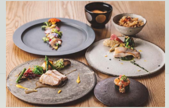
地産地消をテーマに函館の魅力いっぱいの料理を味わっていただきます