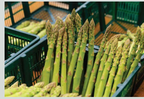
柔らかくみずみずしくジューシーな最高級アスパラガス「海の神」