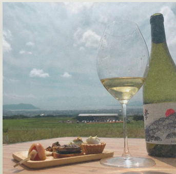
函館湾を望むワイナリーでワインを通して語りながら 思い思いの余白時間をお過ごしください。