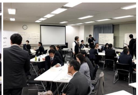
▲ヒューマングループ管理職を対象とした生産性向上に向けたマネジメント研修

当社グループ全体では、労働時間の使い方を抜本的に見直し、時間あたり生産性を向上させていきます。そのために、業務の効率化、システム化を積極的に推進し、社員の労働時間を削減するとともに、多様な働き方を実現していきます。