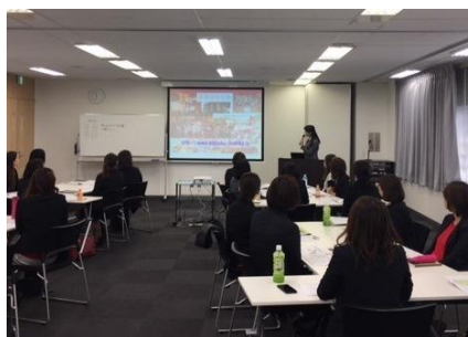
▲ヒューマンアカデミーが独自に実施している女性社員向け研修