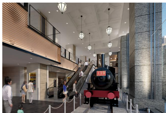
▲桜木町駅が日本の鉄道発祥地であることから1階エントランスに、110形蒸気機関車などが展示