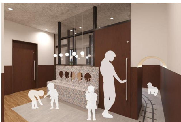
▲プラットホームをコンセプトとした園内(イメージ)