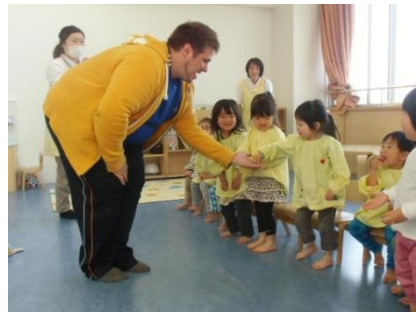
▲これまでの英語学習の様子

そのような中、2020年度から小学校における英語科目が必修化するなど、子どもへの英語教育は大きな変革を迎えようとしています。小学校からの英語学習にスムーズに適応できるよう、これまで以上に未就学児からの英語学習に関心が高まっており、保育園における英語に関する取り組みにも期待が高まっています。