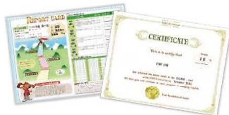
▲英検Jr.テスト受験後に送付される賞状など

当社の園では、小学校での英語学習へスムーズに移行できる力を育むことを目的に、小学校低学年を対象としたグレード、英検Jr.「BRONZE」に準ずる学習に取り組めます。カードやゲームを用いて小学校の英語活動を想定した単語やフレーズを楽しみながら学ぶことができます。英検Jr.「BRONZE」への