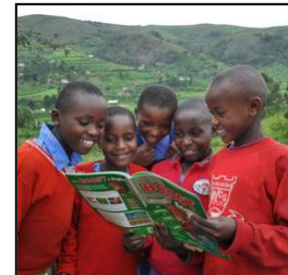
どンドン学ぼう教科書 10冊 （ウガンダ） ¥1,480