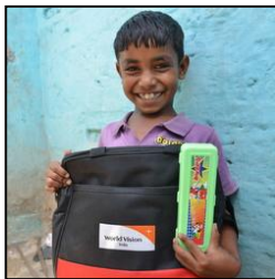
わくわく通学セット （ネパール） ¥5,330