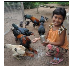
タマゴで栄養めんどりー羽 （タイ） ¥1,210

※ ラブギフトにご協力いただいた皆さまには、ご協力いただいた年の 11 月に、メールにて活動報告をお届けする予定です。