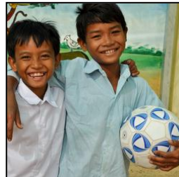
皆で遊べるスポーツセット （ネパール） ¥5,330