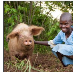
家計お助け豚一頭 （ルワンダ） ¥8,520