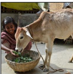
ミルクで栄養乳牛一頭 （インド） ¥52,560