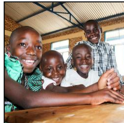
勉強はかどる机・椅子セット （ケニア） ¥11,350