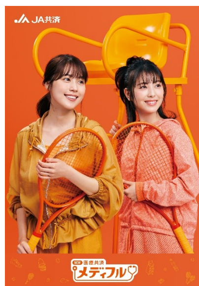
オリジナル A5 ノート

https://www.ja-lifeadvisor.jp/medifulcp/