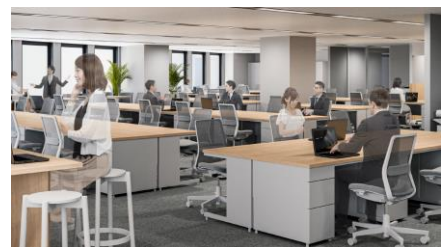
3F ワーキングスペース