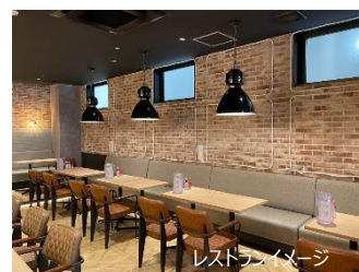
レストランイメージ

変なホテル鹿児島 天文館は、ホテル 1 階に新レストラン「おにぎり割烹 七変化 波美の澄～ka～」を 7 月 20 日（土）にオープンします。種子島をはじめとした、全国の四季折々の食材をふんだんに使用した和食をご提供します。朝食は選べる三種の米俵御膳、黒毛和牛のイチボ寿司、特選米の銀しゃり御膳、白粥御膳の 4 種類からお選びいただけます。