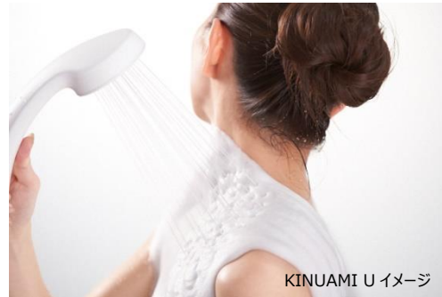
KINUAMI U イメージ

変なホテル東京 赤坂は、開業 6 周年を記念して、ホテルのコンセプトである、「心身共にリラックス」をテーマとした「安眠快眠ルーム」を発売します。株式会社 KURUKURU の究極の寝心地を追求した GOKUMIN ベッドマットレスと、硬さや高さ、形の違う 6 種類の枕をご用意し、株式会社 MTG の足を鍛えるシックスパッド フット フィット 3 と正しい姿勢をサポートする Style 健康 Chair を設置し、株式会社 LIXIL が企画開発した濃密泡が出るシャワー KINUAMI U を採用しました。価格は朝食付き 26,540 円～、素泊まり 25,000 円～（1 泊 1 部屋、税サ込）