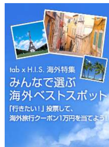
(キャンペーンイメージ)