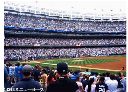
写真はすべてイメージです。