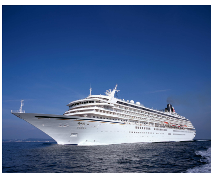
（飛鳥 II 外観）

旅行代金にはクルーズ中、及び各コースの全てのお食事、船内イベントの鑑賞料金も含まれており、「洋上のオアシス」と謳われる飛鳥 II クルーズを最短3日からと身近にご体験頂ける内容となっております。H.I.S.では、クルーズ旅行が今後さらに身近に、そして気軽に楽しんで頂けるよう、積極的に取り組んでまいります。