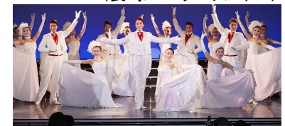
（ハウステンボス歌劇団）

商品ページ： http://www.his-j.com/tyo/cruise/index.htm