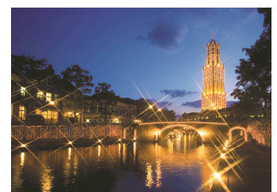
（長崎／ハウステンボス）