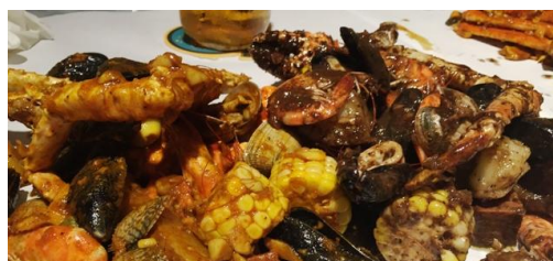
▲クラッキン・キッチン ((イメージ)