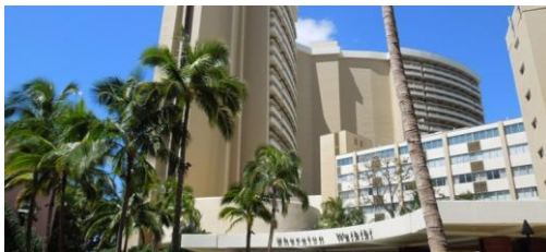
▲シェラトンワイキキホテル(イメージ)

幼児(0～2歳)のお子様は体調を崩しやすい為、いざという時に安心という理由でホテル内に託児所や診療所がある「シェラトン ワイキキ ホテル」が人気でした。また、まだお子様が小さいので、2位に「ハレクラニ」、3位に「アウトリガー リーフ ワイキキ ビーチ リゾート」とご両親の意向がより反映された結果となり、幼稚園児や小学生のご家族に比べて比較的高級ホテルが上位にランクインしたのが特徴的です。また、レストラン編では、食事だけでなくフラダンスショーなどの催しがあり、小さなお子様も食事とショーと一緒に楽しめるという事で、ヒルトン・ハワイアン・ビレッジの屋外で行われる「レアレアバーベキュー」が1位に輝きました。