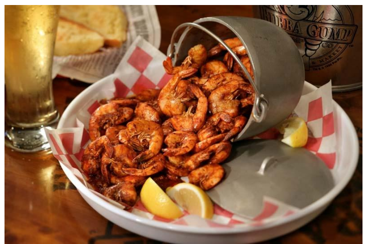
▲幼稚園児がいるご家族にお勧めのレストラン第 1 位 パパ・ガンブ(イメージ)

【H.I.S.SNS 旅トレンド調査】SNS でハワイ好きが決めた！ファミリーで泊まりたい&行きたい！