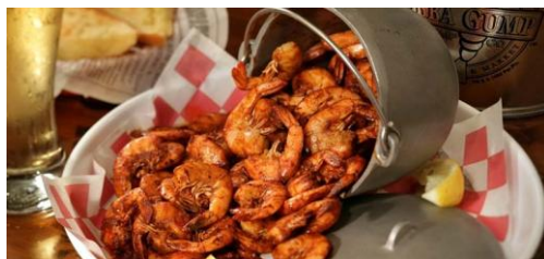
▲パパ・ガンブ(イメージ)