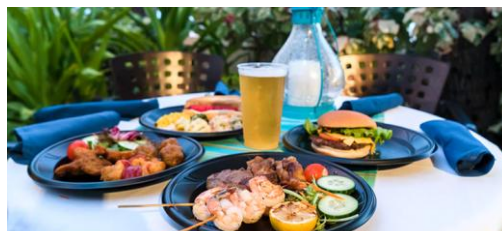
▲レアレアバーベキュー(イメージ)