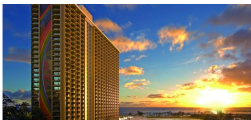
▲ヒルトン・ハワイアン・ビレッジ ((イメージ)

小学生(7～12歳)のお子様を持つお母さんに圧倒的な人気を誇ったのが、ワイキキのランドマーク的存在の「ヒルトン・ハワイアン・ビレッジ」です。4本ものスライダーがある充実のプールや、90を越えるショップなど、リゾート内で全てが完結できる充実さが好評でした。また、レストラン編ではテーブルの上に広げられたシーフードを大人も子供も手づかみで食べる「クラッキン・キッチン」で、みんなでワイワイ楽しみながら食べられるという点で人気でした。