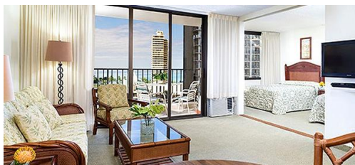
▲アストン アット ザ ワイキキ バニアン ((イメージ)

幼稚園児(3～6歳)のお子様を持つお母さんに人気だったホテルは、「アストン アット ザ ワイキキ バニアン」を始めとするキッチン付きのコンドミニアムタイプのリゾートです。毎食、レストランで食べるより、簡単にお部屋で調理したり、時間に関係無くリーズナブルにゆっくり食べられる点が嬉しいという声を集めました。レストラン編では、色々なものに興味を持ち、気が散りやすい幼稚園児には、料理が運ばれるまでの間、遊べるコンテンツがあると安心ということで、お子様用の塗り絵や椅子を提供してくれるレストランがお勧めとして票を集める中1位に輝いたのは「パパ・ガンブ」でした。