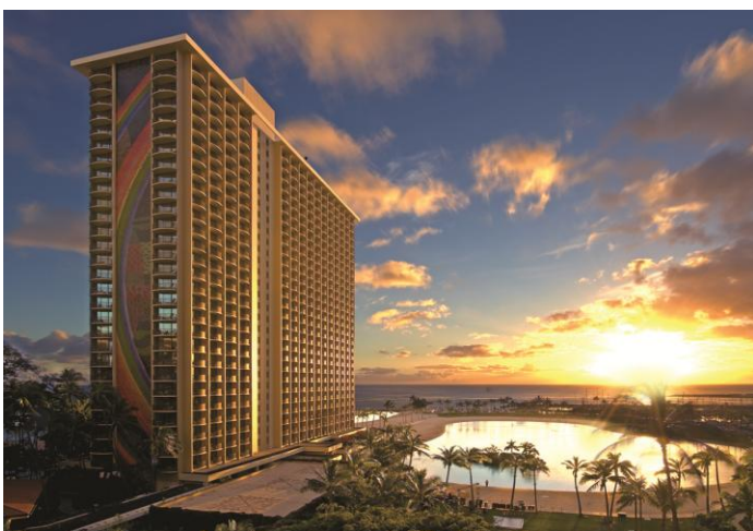
▲小学生がいるご家族にお勧めのホテル第 1 位 ヒルトン・ハワイアン・ビレッジ(イメージ)