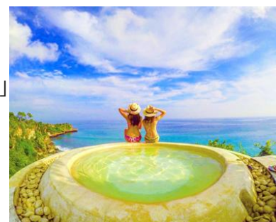
▲ラ ジョヤ II ビウ・ビウ(イメージ)

※Tabijyo (タビジヨ) とは H.I.S.が運用する、旅する女子のための Instagram アカウント