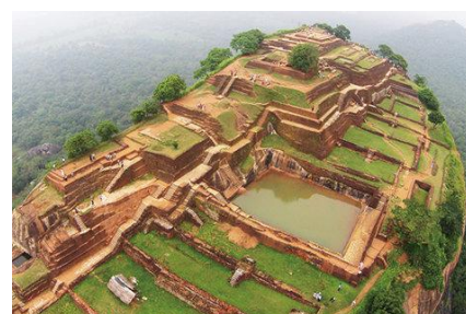
スリランカイメージ