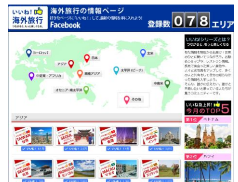
右：いいね！海外旅行 イメージ