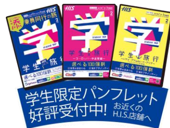
パンフレット イメージ

■ 学生ページURL: http://www.his-j.com/gakusei/