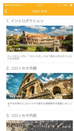
アプリ名：Pokke ※iPhoneのみ対応

卒業旅行として人気が高いイタリアにおいては、H.I.S.の現地支店ネットワークを活かし、世界一の数を誇る世界遺産や観光スポット、それらにまつわるエピソードを、オリジナルの音声ガイドとしてアプリにまとめました。H.I.S.をご利用いただいた学生さんには、有料コンテンツを期間限定（2016年12月16日出発～2017年3月31日出発）で無料にて提供いたします。