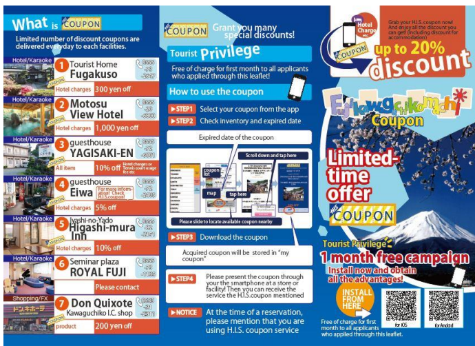
【「富士河口湖タイムセール」パンフレット】