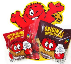
▲ニュージーランドで定番人気のオーガニッククッキー。