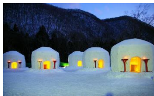
湯西川かまくら祭りイメージ