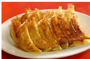
宇都宮餃子イメージ