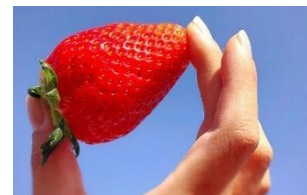
スカイベレー イメージ