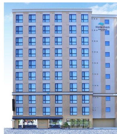
ホテル外観（イメージ）

「ウォーターマークホテル京都」は、「水」や「ブルー」をテーマとした「伝統的な和の世界観を体感」できる空間を演出いたしました。HIS.H.H.が運営するホテルとして、京都地区2拠点目となり、レジャー・ビジネスなど幅広いお客様層にご満足いただけるよう、京都ならではの絶好のロケーションと日本の伝統が一体化した京都だからこそ味わう事ができる唯一無二のくつろぎを、館内・客室の高品質と快適さを兼ね備えたワンランク上のサービスを国内外のお客様へ提供してまいります。