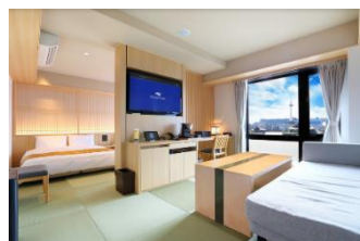
スイートルーム（イメージ）