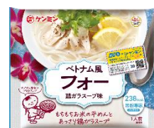
シール貼付イメージ