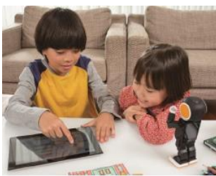
タブレット操作（イメージ）