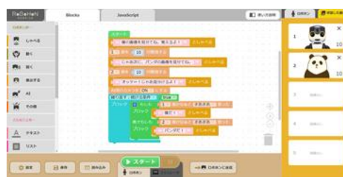
タブレット画面（イメージ）