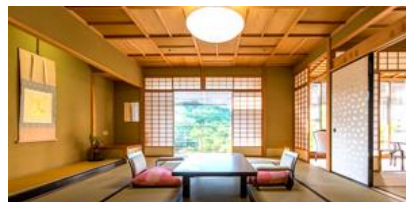
絶景を楽しめる露天風呂付客室も