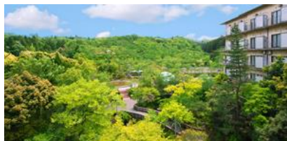
広大な庭園には千本桜、山茶花なども

新館の一部客室をリノベーション、大浴場を改修、庭園・展望台・プール・テニスコートを整備、ドックランを新設し、2021年7月より新館の客室のみで営業を開始いたします。全館での営業は旧館客室の改装終了後の2021年12月を予定しております。観光客だけでなく地元小松市、石川県、北陸地区の方にも選ばれる温泉旅館・レジャースポットを目指してまいります。なお、販売開始・ホームページ開設は4月を予定しております。