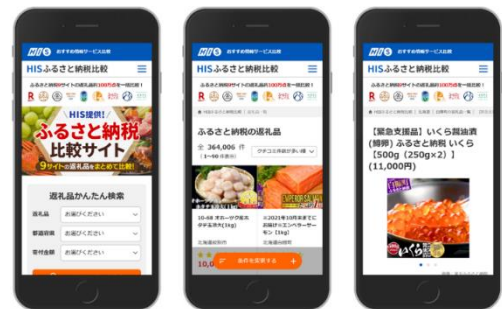
スマートフォン画面イメージ

サイトごとの特徴を比較することで、わかりにくさを軽減することが出来れば、関心や興味を持っていただく方の増加に繋がり、ふるさと納税が地域の魅力向上につながると考えております。これまで観光業を通じて人と国と地域を結んできた HIS ですが、このサービスにより、お客様、自治体、取引先の皆様が有益を得られる関係を築けるよう、しいては地域への貢献の一助となるよう、今後も様々な取り組みを進めてまいります。