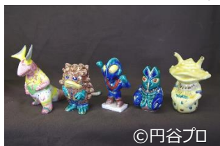
絵付け体験/イメージ