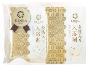
金箔入り入浴剤/イメージ