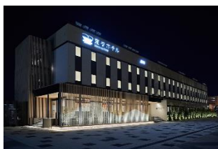
夜間外観/イメージ