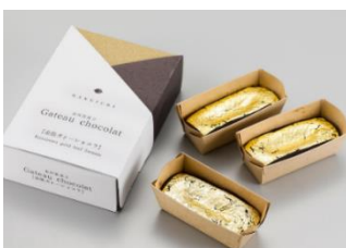
金箔ガトーショコラ/イメージ