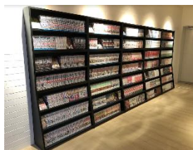
コミックコーナー/イメージ