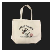
トートバッグ/イメージ