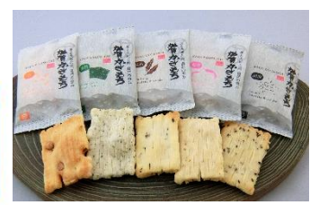
加賀かきもち/イメージ

<「お土産ルームオーダー」> https://henhotelkomatsu.lbb-r.com/