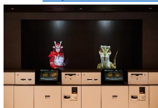
フロント/イメージ