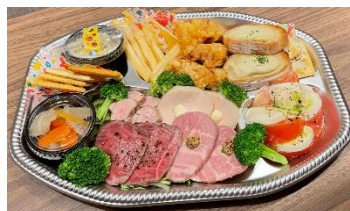
洋食オードブル/イメージ