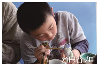
絵付け体験/イメージ

ホテル近隣の但馬鮮魚店・エムラインマーケットとコラボし、変なホテルオリジナルメニューの和洋から選べるオードブルとドリンク付プラン。お1人様1泊6,150円～（税・サ込、夕食付/2名様1室利用時）