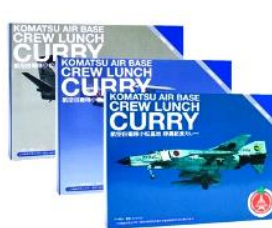
自衛隊カレー/イメージ