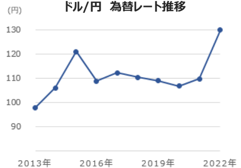
ドル/円 為替レート推移

ホテルや空港など観光業に携わる人手が不足する中、急激な旅行需要の回復や物価上昇の余波などを受け、国によってホテルや航空運賃などが値上がりする傾向にあります。航空機にかかる燃油サーチャージは、原油価格の変動に伴い12月以降引き下げとなる会社もございますが、引き続き価格高騰が続いており旅行消費額はコロナ前と比較し上昇しております。