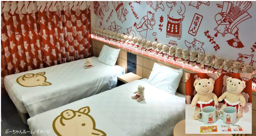
ぶーちゃんルーム/イメージ

H.I.S.ホテルホールディングス株式会社（本社：東京都港区）が運営する「変なホテルエクスプレス名古屋 伏見駅前」は、名古屋名物みそかつの「矢場とん」の夕食付で、イメージキャラクター「ぶーちゃん」で客室を飾った「ぶーちゃんルーム」を本日7月21日（金）より発売、7月22日（土）より宿泊提供を開始いたします。