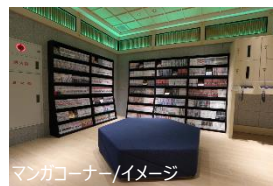
マンガコーナー/イメージ