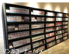
マンガコーナー/イメージ