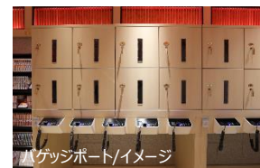
バゲッジポート/イメージ

所在地：〒460-0003 愛知県名古屋市中区錦 1-10-10 電話：052-223-0170