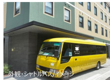
外観・シャトルバス/イメージ