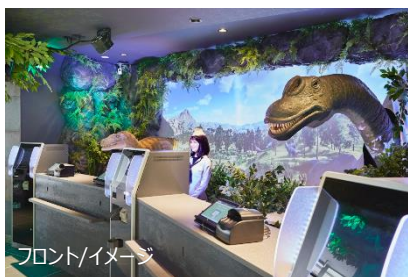
フロント/イメージ