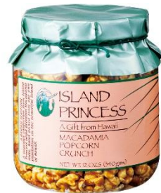
アイランドプリンセスポップコーン

人気フォトグラファー Atushi Sugimoto さんによる、H.I.S.Hawaii 限定デザインの携帯カバーや PC ケースなどを入荷。