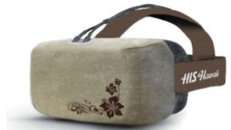
(オキュラスリフト イメージ)

通常は黒く重量感のあるオキュラスゴーグルに、ハワイらしいオリジナルのデザインを施すことで、より店舗との一体感を演出いたしました。