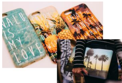
Always Sunshine. Co

日本未上陸「24karats surf」がH.I.S.Hawaiiのためにデザインしたタオルを限定 100枚で販売。