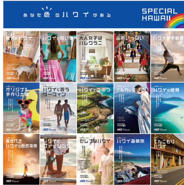
(パンフレット ラインナップ)