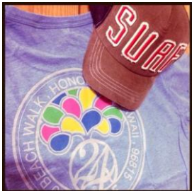
24 karats surf

- 今まさに旬又はこれからブレイクの予感がする、日本ではここでしか手に入らないようなハワイ商品がラインナップ - ハワイラヴァーズなハワイアンアーティストとのコラボ商品、現地レアレアマガジン編集長がお勧めするハワイの隠れ人気商品など、旬なハワイグッズを入荷。ハワイ好きはもちろん、ハワイには興味があるけど、まだハワイにはいったことのない方も気軽に立ち寄れる空間を目指しました。