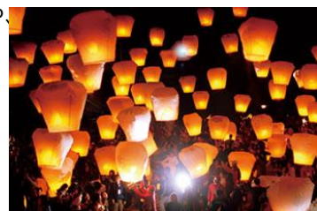
▲十分の天燈(ランタン)上げ(イメージ)

本キャンペーンの結果を受け、1 位に輝いた十分(じゅうふん)での天燈(ランタン)上げ体験をツアーに盛り込んだ新商品を造成し販売いたします。今回のランキングを参考に、ぜひ台北以外の街の魅力を楽しんで頂ければと考えております。