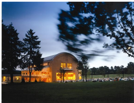
タングルウッド セイジ・オザワホール

また、2016 年はモーツァルト生誕 260 周年を迎えます。モーツァルトの生誕地オーストリア・ザルツブルクで毎年行われる「ザルツブルク音楽祭」は期間中に数十万人が訪れ、出演者の顔ぶれや公演の質・量ともに世界最大規模の音楽祭です。クオリタ音楽鑑賞デスクでは、モーツァルトのオペラの代表作「ドン・ジョヴァンニ」「コジ・ファン・トゥッテ」の人気 2 作品、交響曲は 3 大交響曲とも呼ばれる、第 39 番、第 40 番、そして第 41 番「ジュピター」の 3 曲を一度に鑑賞するツアーを発売しました。音楽鑑賞専門デスクは、音楽が好きなハネムナー、60～70 代層、親子旅など様々なお客様にご利用いただいております。