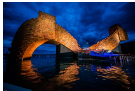
ブレゲンツ音楽祭の様子