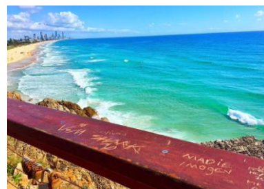
▲マイアミビーチ(イメージ) @aichinnnnnnnnn さんのお写真

※Tabijyo (タビジヨ) とは H.I.S.が運用する、旅する女子のための Instagram アカウント