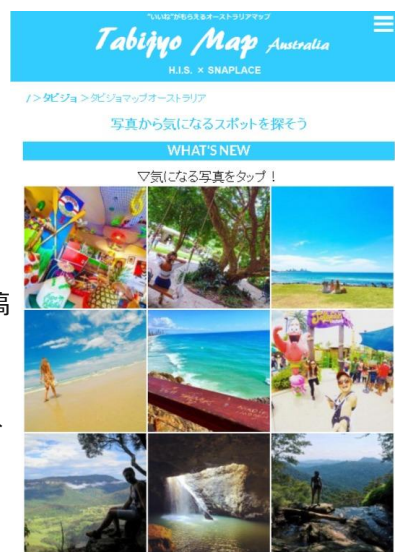
▲Tabijyo Map Australia (イメージ)