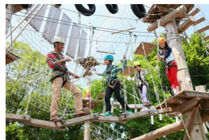
ハウステンボス(イメージ)

http://nippon.his-j.com/tour_detail/TK-FNN1717-GWA2/