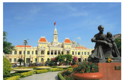
ホーチミン(イメージ)