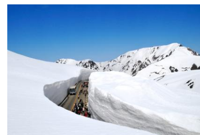
立山黒部アルペンルート雪の大谷(イメージ)

バスツアーにおいては、関東近県を中心としたご予約が多くみられます。手頃な価格で参加できるバスツアーは人気が高く、ご自身で運転する必要がない分食事の際の飲酒なども楽しむことができ、お子様からお年寄りの方まで気軽にご参加いただけることが利点です。宿泊バスツアーでは、立山黒部アルペンルートを中心としたツアーが1位であり、高さ約20mにも迫る「雪の大谷」が4月下旬に最高位に達するため、この時期の人気が集中しています。日帰りバスツアーでは、ネモフィラ（ひたち海浜公園）や大藤（あしかがフラワーパーク）などGWに満開の見頃を迎えるお花鑑賞コースに人気が集まる結果となりました。