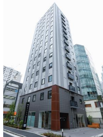
変なホテル東京 浜松町 外観

また、世界のトップアスリートに数多くのボディケア商品を提供しているファイテン株式会社と連携し、3 階フロアの客室、廊下すべてにアクアメタル技術を施した、世界初の「ファイテンルームフロア【ファイテンスペースデザイン】」を展開します。ファイテンルームとは、壁紙やカーペットに心身を本来のリラックス状態へと導くファイテンの水溶性メタル技術「アクアチタン」を含浸しファイテン技術を施した空間を創り出し、且つ、寝具には「アクアゴールド」含浸した羽毛を採用しております。宿泊時のお客様のボディケアをサポートいたします。