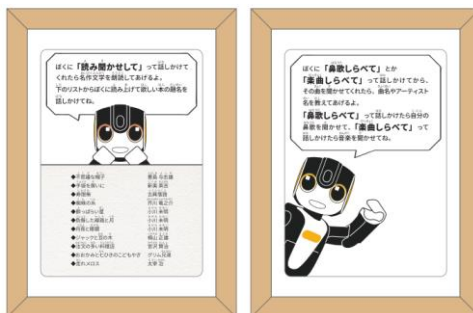
ロボホンルーム・客室説明パネルイメージ

ロボホンが宿泊客にむけて、客室のご案内をはじめ、宿泊客が翌日のチェックアウト時間やWi-Fiのパスワードなど、ホテルに関する質問をすると、ロボホンが回答いたします。他にも、さまざまな名作文学を朗読してくれる「読み聞かせ」や、楽曲や鼻歌を聞かせるとその曲のアーティスト名やタイトルを教えてくれる「この曲何？」のほか、すぐに遊ぶことができるミニゲームなど、お客様に楽しんでいただけるアプリケーションもご利用いただけます。