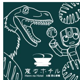
ロボホンルーム宿泊者特典ステッカー イメージ

「変なホテル大阪 西心斎橋」の3階をロボホンルームフロアとし、フロア内全15室に、シャープ社が開発するモバイル型コミュニケーションロボット「ロボホン」の着座タイプ「RoBoHoN lite」<SR-05M-Y>を設置いたします。客室に設置されたロボホンが、宿泊者の専属コンシェルジュとなり、ホテル館内情報の案内や、観光情報、天気、ニュースなどをご案内するとともに、歌やダンスはもちろん、クイズや物語を読むなど、コミュニケーションも強化され、客室内での新しい体験を提供いたします。