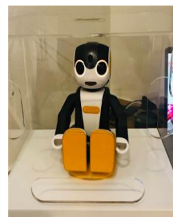
客室内 RoBoHoN lite イメージ

今後、バージョンアップにより、定期的におすすめの情報を話しかけてくるようになるほか、モーニングコールやタクシーの配車機能、客室内の空調、照明、TVの操作やフロントへの連絡や、お客様に応じて言語や情報が変わっていくなど、シャープ社と連携し、さらに利便性を高める進化した客室でのロボットサービスをご提供していく予定です。