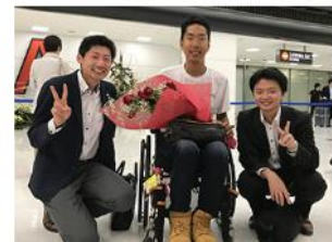
三代さん 世界一周旅行の様子