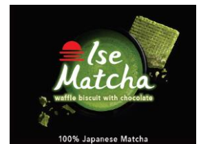
シリン社 抹茶チョコパッケージ

みかんの加工商品は、エアウォーターグループの(株)見方 ( https://mikata.co.jp/ ) が担当し、現在みかんをベースにした新商品を開発中です。また、社会貢献としては、NPO 法人「子供地球基金」 ( https://www.kidsearthfund.jp/ ) にご協力をいただき、同法人が扱う子供たちの力強い絵を日本製茶商品及びみかんの木グローバルオーナーに届けられるみかんの加工商品パッケージへの採用することが決定されています。