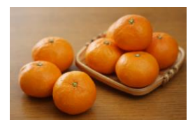
三重県・みかん イメージ