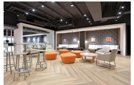
LeaLea ラウンジイメージ

ハワイを訪れる観光客は、個人旅行者が 41.2%（出典：Hawaii Tourism Authority）を占めており、年々個人旅行の需要が増加傾向にあります。LeaLea ラウンジでは、その多様なニーズにお応えするため、個人旅行者向けの専用スペースを従来の約 1.5 倍に拡大し、ハワイでの個々のニーズに対応した、多彩な過ごし方をご提案いたします。この LeaLea ラウンジを通して、ハワイにお越しのお客様がそれぞれのハワイを発見し、かけがえのない思い出をつくっていただけるよう、お手伝いしてまいります。