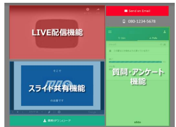
(WEB セミナーサービスイメージ)

また、このシステムは配信に特化したもので、会議システムにありがちな、参加者がミュートに出来ていないことによる話の中断、突然の参加者による全体への資料共有等は起きない設定となっております。