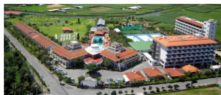
ホテル全景（イメージ）

※価格は1泊1部屋あたり、スタンダードツインルーム 13,200 円～、デラックスツインルーム 15,400 円～、和洋室 17,600 円～（いずれも素泊まり、税・サービス料込）