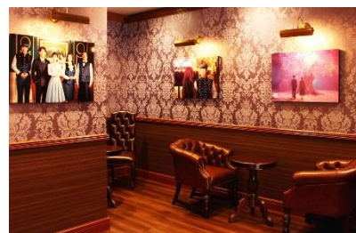
レトロカフェ風エリアにはドラマのパネルが