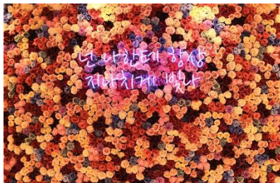
フラワーウォールにはドラマの有名なセリフが