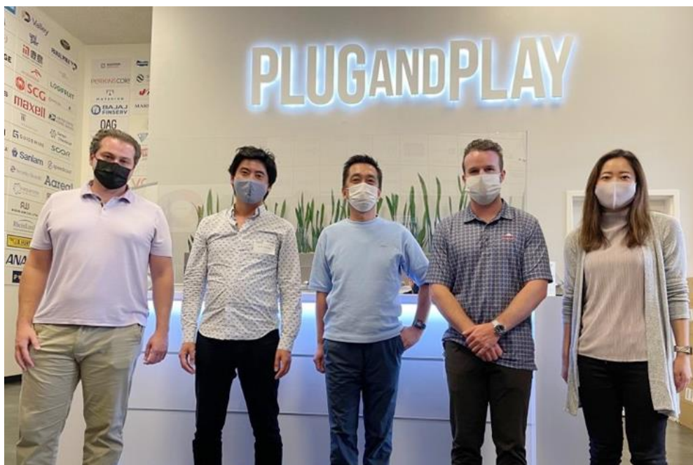
(Plug and Play シリコンバレーと HIS アメリカ法人のメンバー)

HIS アメリカ法人は、2020 年より Plug and Play にコーポレートパートナーとして参画しており、Port Remote Pte. Ltd. (本社：シンガポール https://www.theportapp.com/ )、CHOOOSE™ (本社：ノルウェー オスロ https://choose.today/ ) との業務提携・投資を行ってまいりました。これらの実績と、コロナ禍において旅行業界が困難な状況の中、サステナブルツーリズムを推進する新ブランドの旅行予約サイト「Copollo」を立ち上げたこと、投資機会を探索する視野を持ち続けていることが評価され、受賞いただきました。