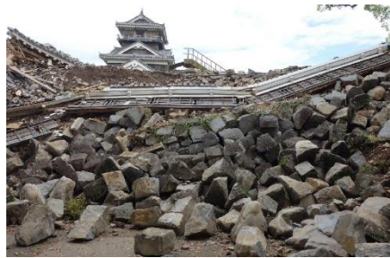
▲熊本地震後の石垣の様子