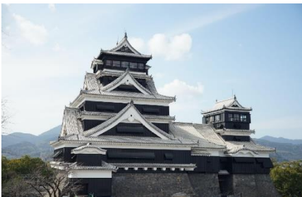
▲復興後の熊本城天守閣イメージ

本企画は、熊本県民の、そして観光のシンボルである熊本城の現状を知っていただき、復興応援の一助になればとの思いから、熊本に縁のある「アイドルマスター シンデレラガールズ」のアイドルとのコラボレーションを企画いたしました。