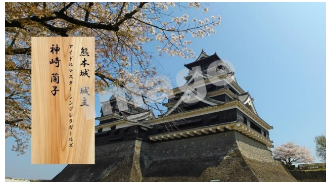
▲デジタル芳名板の表示(イメージ)