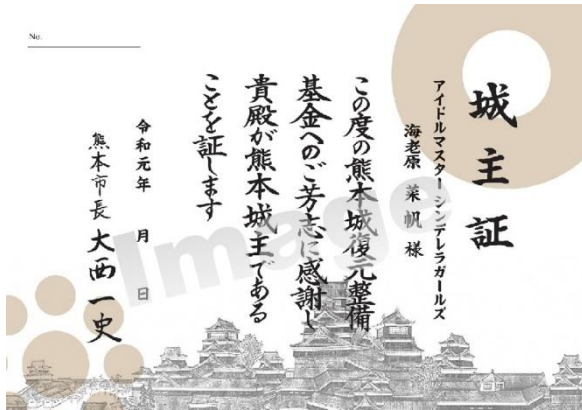
▲熊本城復興城主による城主証(イメージ)