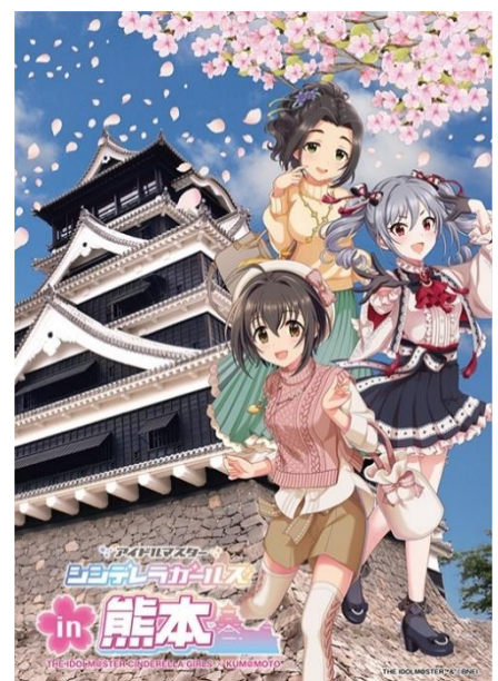
▲特別描き起こしイラスト