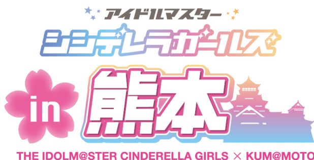
▲本キャンペーンのロゴマーク

なお、本コラボレーション企画の売上の一部も熊本城復旧・復興支援として、九州産交グループより熊本城に寄付する予定です。