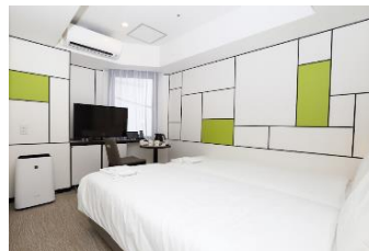
左から、フロントイメージ、ロビーロボットイメージ、客室一例イメージ