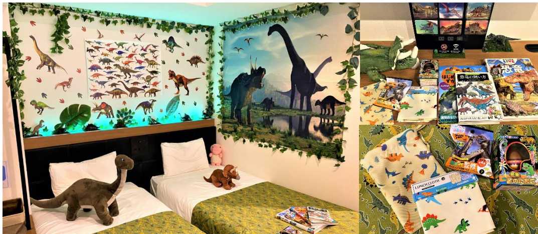
左：客室イメージ、右上：デスクイメージ、右下：プレゼントイメージ

「変なホテル」のフロントでは恐竜ロボットや恐竜キャラクター映像がお客様をお出迎えし、チェックインのお手伝いしております。フロントだけでなく客室でも恐竜との触れ合いをお楽しみいただき、ホテル滞在を旅の思い出の1ページにさせていただきたいと考え、変なホテル舞浜 東京ベイ、変なホテル東京 西葛西、変なホテル仙台 国分町の3ホテルにて、客室を恐竜柄で装飾した“恐竜ルーム”を展開しております。特に小さなお子様のいらっしゃるファミリーのお客様からご好評いただいたことを受けて、今回、関西エリアでも観光のお客様が多い「変なホテル大阪 なんば」にて“恐竜ルーム”を設定いたしました。