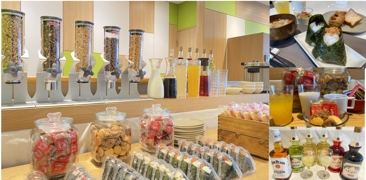
左：ラウンジイメージ、右上：朝食イメージ、右中：ティータイムイメージ、右下：パーティタイムイメージ

変なホテル大阪 心斎橋 —朝食、菓子やドリンクなどを無料でご提供するご宿泊のお客様専用ラウンジ—