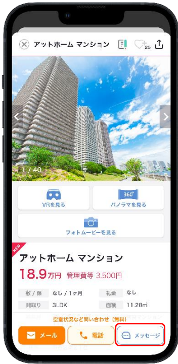
▲不動産情報アプリ「アットホーム」 物件情報イメージ

「メッセージ問合せ」は不動産会社と消費者が不動産情報アプリ「アットホーム」を通してメッセージのやり取りができる新機能です。消費者は不動産情報アプリ「アットホーム」の物件情報にある「メッセージ問合せ」ボタンから、不動産会社に問合せをすることができます。不動産会社から返信があった場合、不動産情報アプリ「アットホーム」に通知が届き、消費者と不動産会社はアプリ上で連絡を取り合うことができます。また、不動産会社は専用の管理画面でメッセージの受信・返信が可能です。