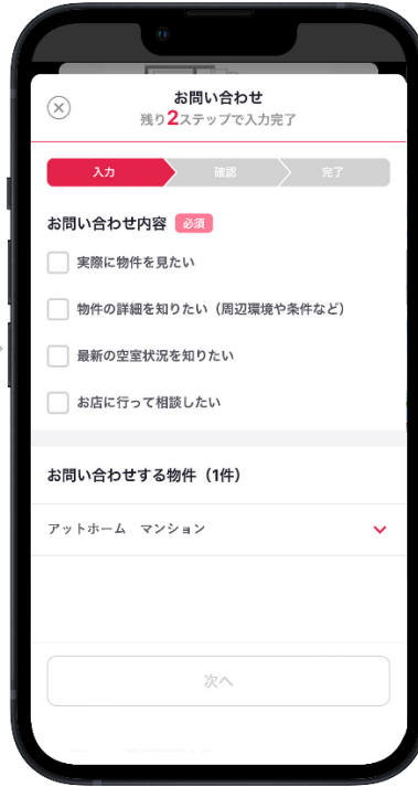
▲不動産情報アプリ「アットホーム」 問合せ入力画面イメージ