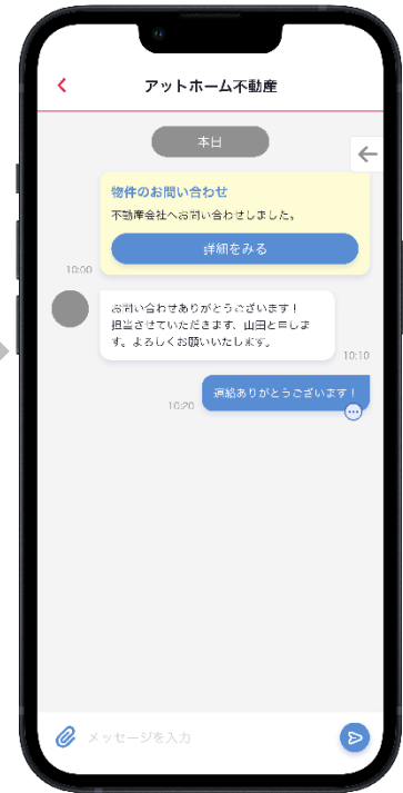
▲「メッセージ問合せ」チャット画面 イメージ