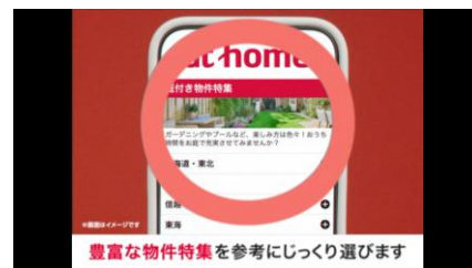
▲理想の生活に合う家篇