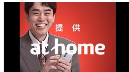
▲新築・中古・注文住宅で迷う篇