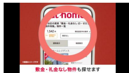
▲初期費用抑えたい篇