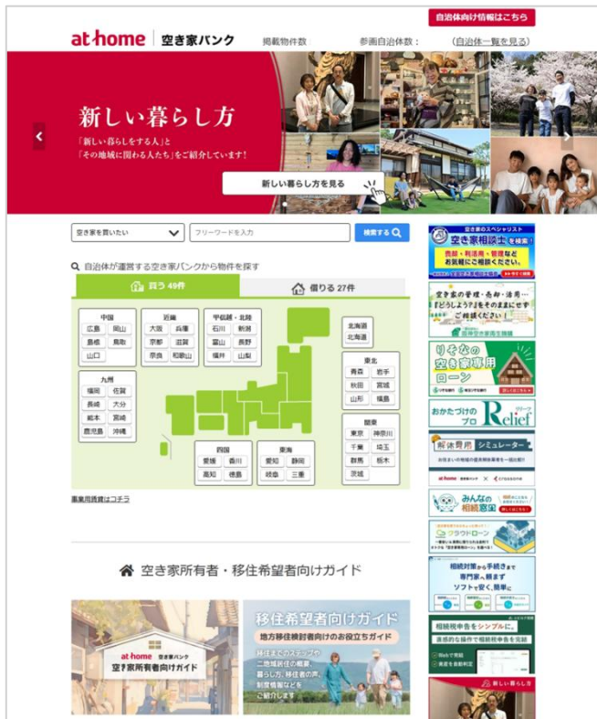
アットホーム 空き家バンク