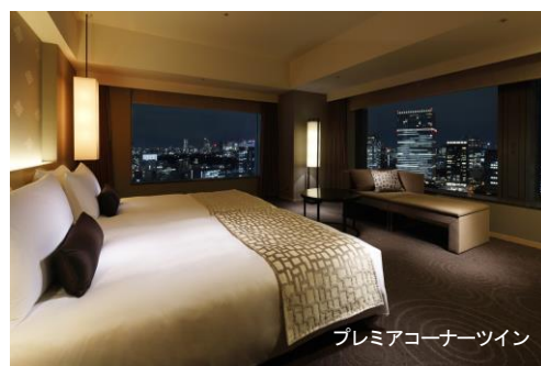
プレミアコーナーツイン