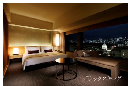
デラックスキング

※スパトリートメントはカウンセリング+ヴァイタルスパ+施術で、合計120分程度でございます。 ※ご予約をキャンセルされる場合は、所定のキャンセル料(違約金)を申し受けます。 ※表示金額には、サービス料(10%)と消費税が含まれております。 ※別途、東京都宿泊税が加算されます。