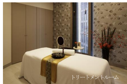
トリートメントルーム

★ご要望に応じてトリートメントの時間延長やオプションの追加が可能です。 ★女性・男性ともご利用いただけます。