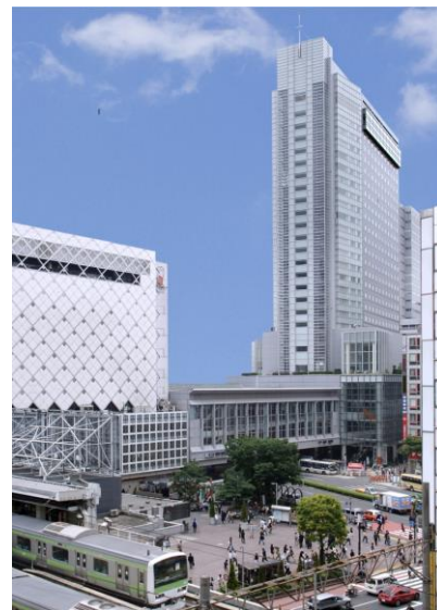
渋谷エクセルホテル東急 外観