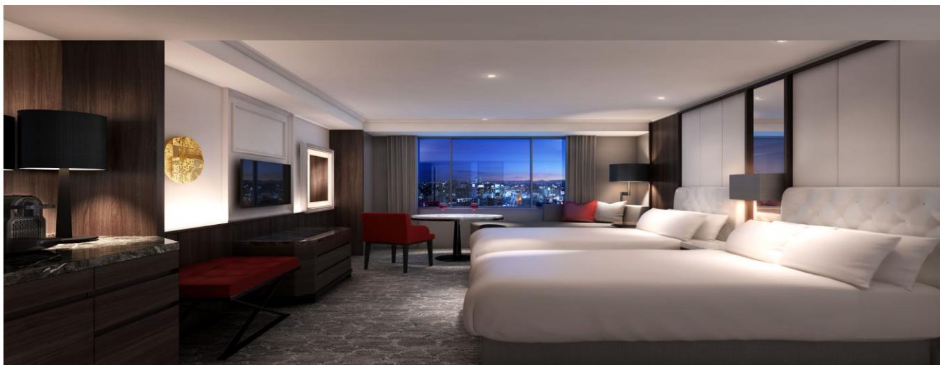
改装後 エグゼクティブフロア客室 イメージ

■ 改装コンセプト : ホテルコンセプト「ヨーロッパエレガンス」を承継しつつ、現代の新しいエッセンスを取り入れ、シティホテルとしての品位や風格を感じさせる、水と緑をテーマとしたオアシスの再現