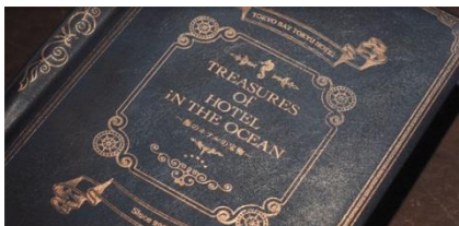
【お父さんの書斎にある一冊の本】