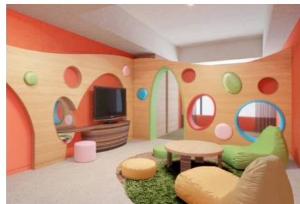
ワンダーランド (コンセプトルーム)