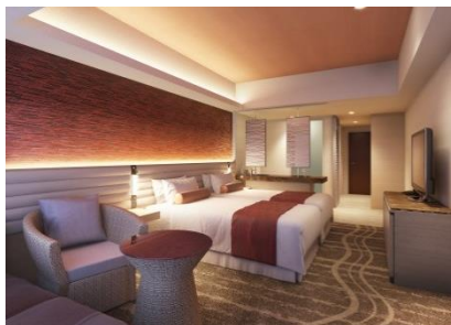
AKANE (デラックスルーム)