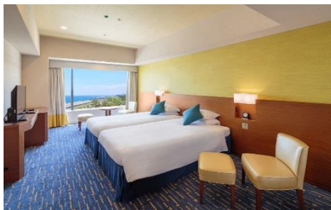
UMI (スーペリアルーム)