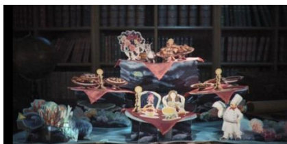
【海のホテルのレストラン】