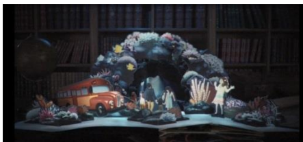
【海のホテルのエントランス】