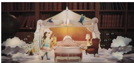
【海のホテルのお部屋】