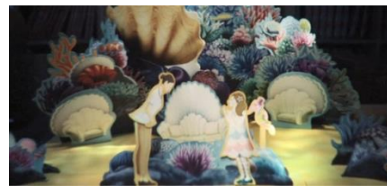
【海のホテルのラウンジ】